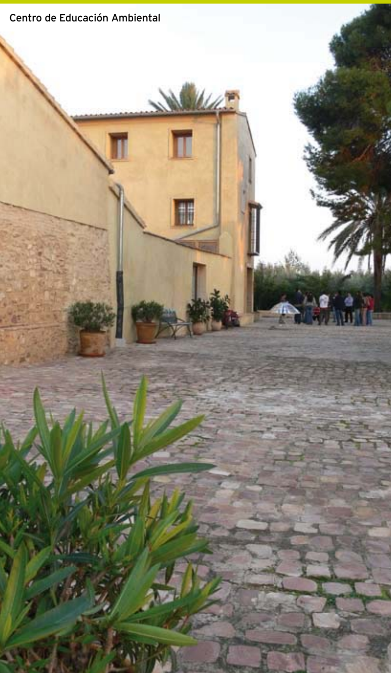
Centro de Educación Ambiental